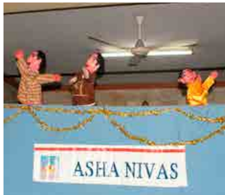
Summer Camp for fadderbørn Asha Nivas 2015