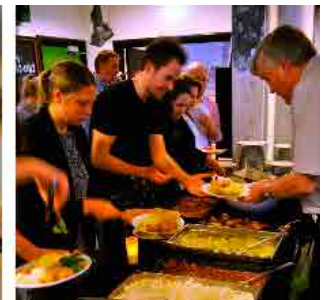
Jubilæumsfesten bød på en lækker eksotisk sydindisk buffet